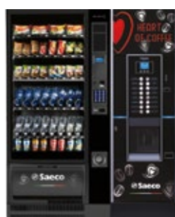
Artico L + Cristallo Evo 600