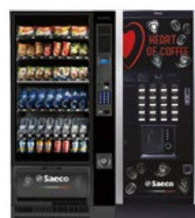
Artico L + Atlante Evo 700