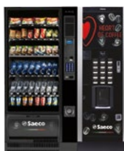
Artico L + Atlante Evo 500